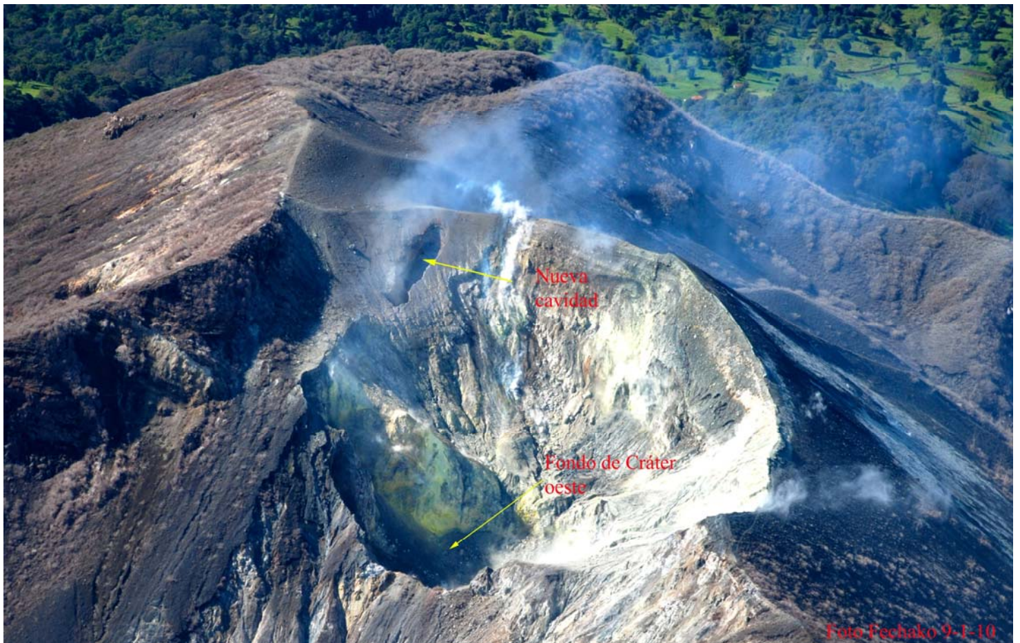
Fig. 1. Visión general del cráter oeste y su posición relativa a la cavidad nueva.

Es importante notar que la pared externa a la derecha (flanco NW) muestra el color blanquecino, reportado en informes de campo desde hace varios meses, la cual tiene temperaturas cercanas a los 90°C. Otros detalles no observables en esta fotografía se pueden apreciar en la figura 2, la cual se obtuvo haciendo un acercamiento de esta primera.