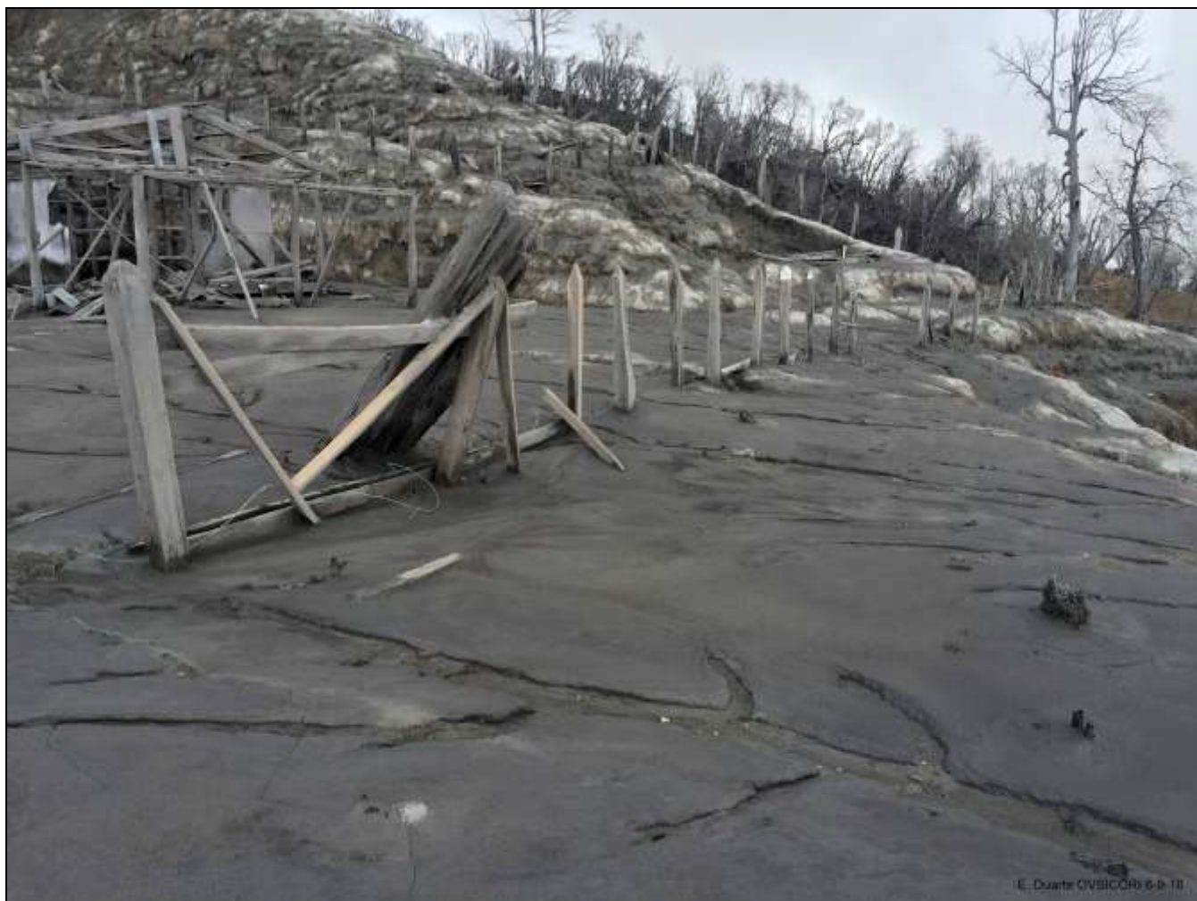
Fig. 5. Piso de lechería y vivienda cubiertos por una espesa capa de ceniza.