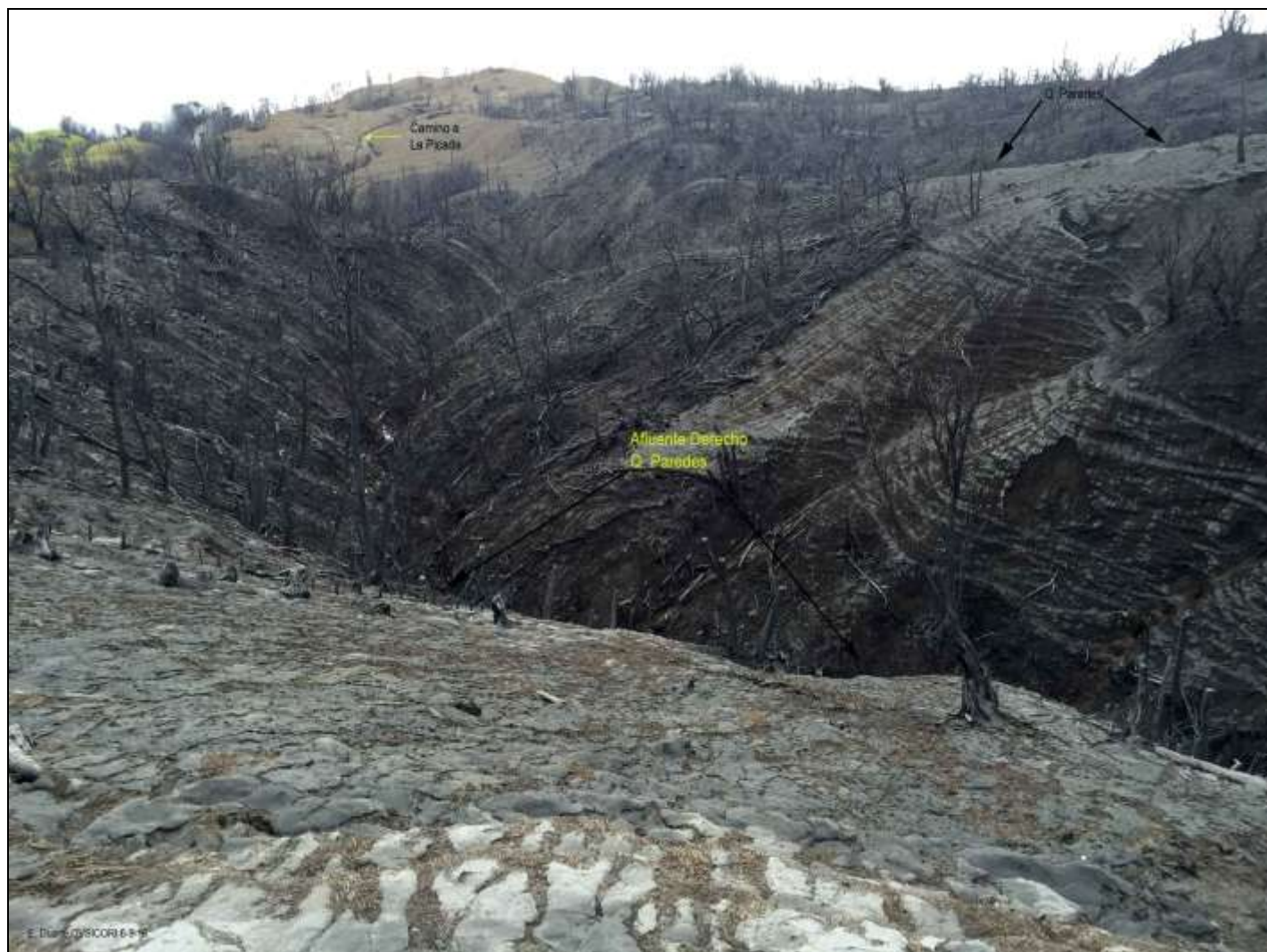
Fig. 6. Corredor principal de troncos y ramas que eventualmente se unirían al río Toro Amarillo.

La siguiente parada se realiza en el borde de la parada 5, mirando hacia el noroeste en dirección hacia La Picada. Desde este punto se alcanzan unos 2 kms en línea recta de terrenos escabrosos cubiertos por ramas y troncos hasta topar con lo que antes fueron ricos repastos; aún en zonas planas, cerca del camino principal. En primer plano se observa al menos 1 km del recorrido del afluente principal de la quebrada Paredes y las fuertes pendientes que amenazan con aportar grandes cantidades de troncos y ramas en caso de lluvias o sismos fuertes. Fig. 6.