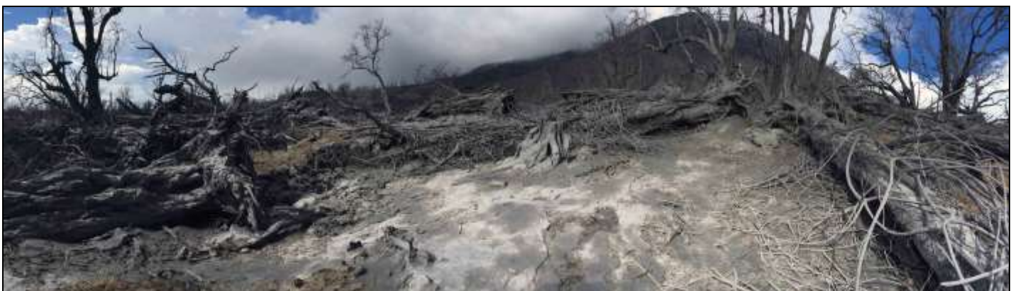
Fig. 3. Flanco oeste (a unos 2 kms del cráter) mostrando una panorámica de árboles caídos.

Los enormes troncos tumbados, a pesar de haber estado así por meses y años podrían tener un valor comercial; para leña, madera o carbón. Debido a que se encuentran dentro de los límites del parque nacional probablemente necesitarían los permisos respectivos para su explotación. Las hojas, ramas y trepadoras, otrora densas, todavía forman un colchón sobre el suelo previo. Sin embargo amplios sectores muestran paños importantes del territorio donde esos materiales se han deslizado por pendientes fuertes hasta alcanzar el cauce de ríos y quebradas o bien se han depositado en las zonas planas que se intercalan en esa rugosa topografía. Fig. 3.