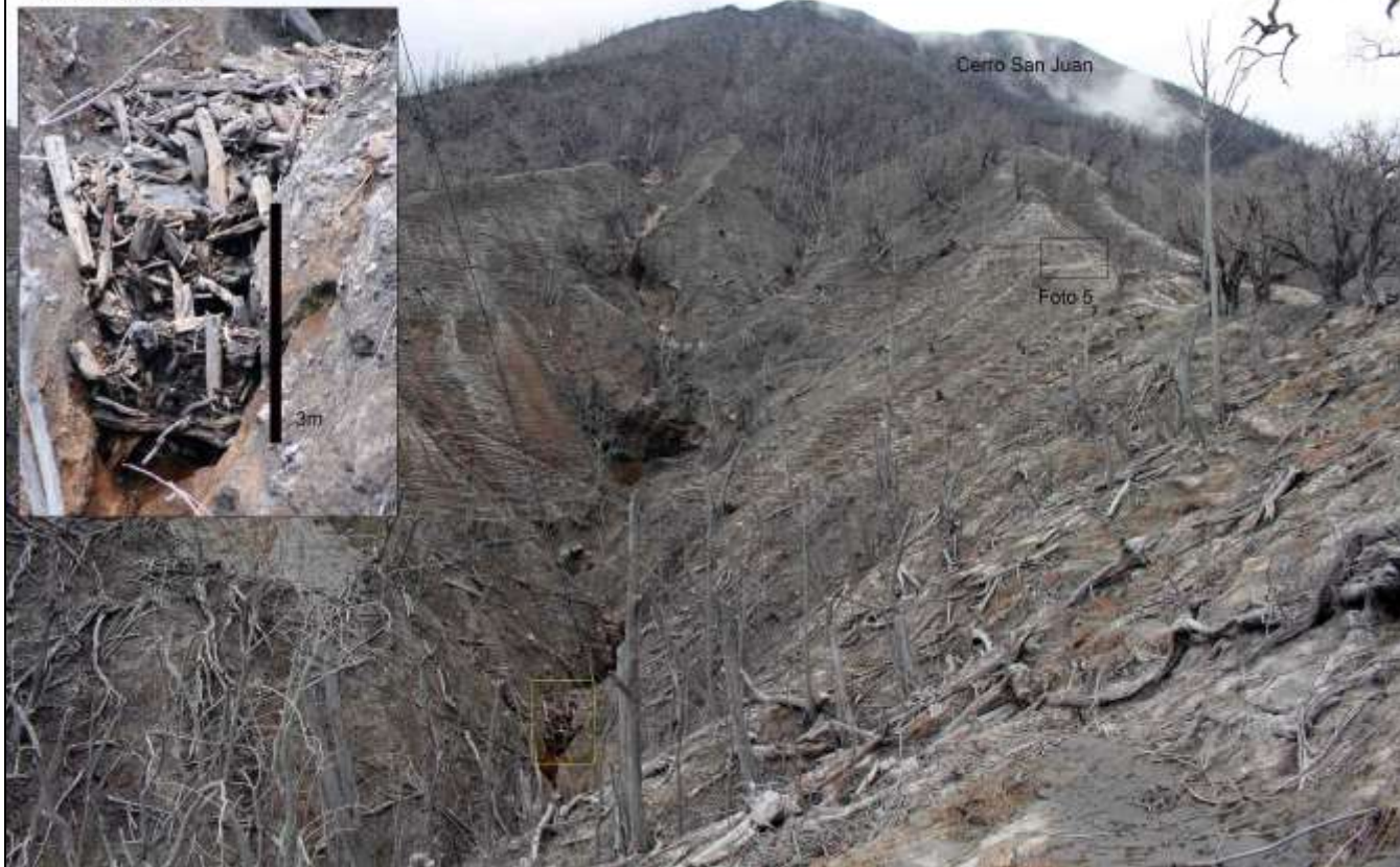
Fig. 4. Cuenca del afluente derecho de Quebrada Paredes en el flanco intermedio del Cerro San Juan.

Afluente Derecho, C. Paredes V. Turrialba. 6-9-16