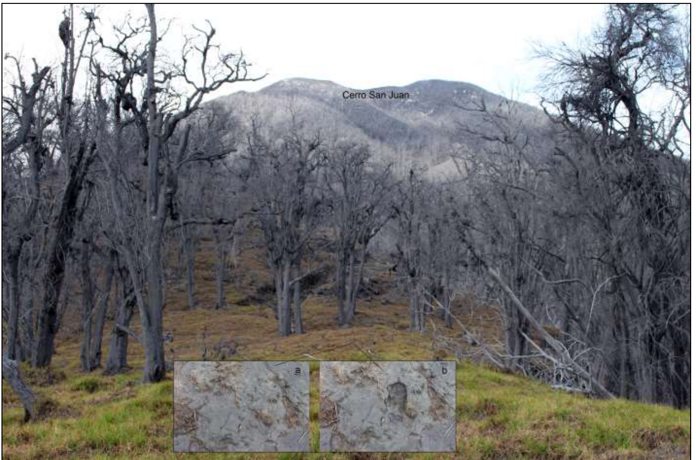
Fig. 2. Sector intermedio con pasto marchito. Los cuadros a y b ilustran el hundimiento al pisar la capa suspendida de ceniza; típica en la zona.

Los enormes troncos tumbados, a pesar de haber estado así por meses y años podrían tener un valor comercial; para leña, madera o carbón. Debido a que se encuentran dentro de los límites del parque nacional probablemente necesitarían los permisos respectivos para su explotación. Las hojas, ramas y trepadoras, otrora densas, todavía forman un colchón sobre el suelo previo. Sin embargo amplios sectores muestran paños importantes del territorio donde esos materiales se han deslizado por pendientes fuertes hasta alcanzar el cauce de ríos y quebradas o bien se han depositado en las zonas planas que se intercalan en esa rugosa topografía. Fig. 3.