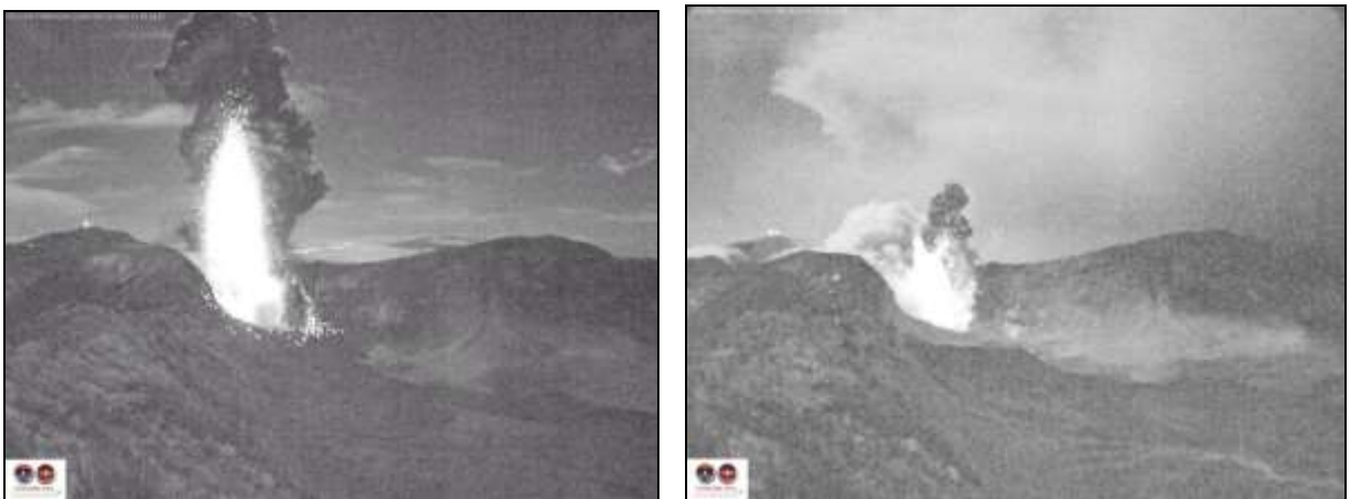
Fig.9. Eventos con sólidos incandescentes tomados en el 2016 desde la cámara del OVSICORI.

En ocasiones ha habido desbloques del conducto que arrojan a la superficie un importante monto de material incandescente; mucho del cual se queda en cercanías de la boca pero otro monto sale en forma de fragmentos que vuelan a cientos de metros, en distintas direcciones. Ejemplos de esto los tenemos el 29 de octubre de 2014, 12 de mayo 2016, el 19 de setiembre de 2016, etc., cuando eventos específicos aportaron un espectáculo que muchas veces quedó registrado en las cámaras que el OVSICORI tiene dispuestas para el monitoreo correspondiente ( Fig.9 ).