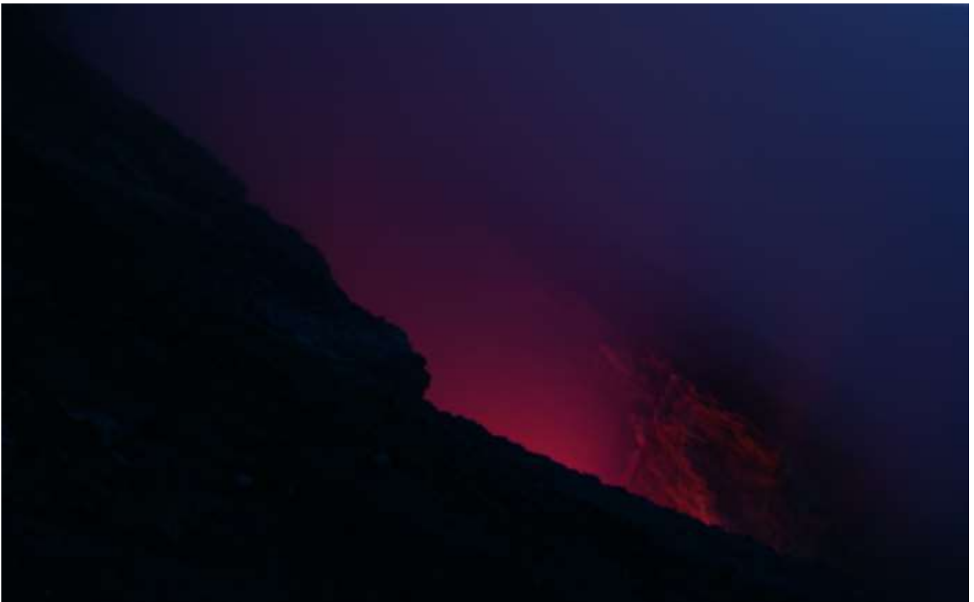
Fig.5. Boca abierta en enero 2010. La temperatura del piso cercano alcanzó hasta 200°C.

La boca abierta a mitad del 2011 en el fondo del cráter oeste se mantuvo incandescente por semanas y podía ser observada desde el borde sur del cráter a unos 300m de distancia. Debido a la emanación continua de gases y vapores desde el fondo su visibilidad era más bien rara ( Fig.6 ).