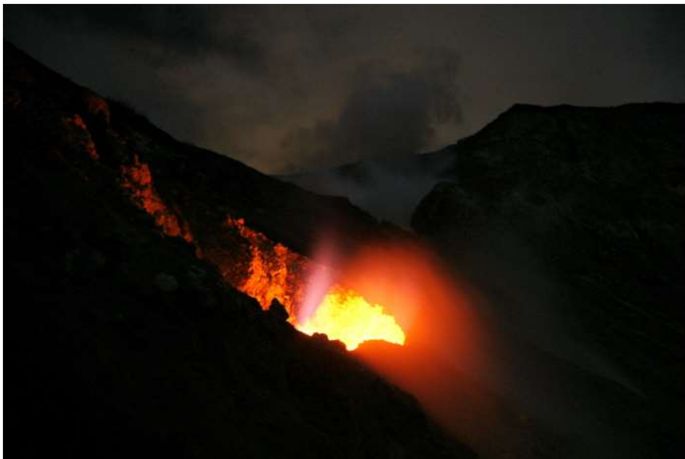
Fig.1. Boca sureste del cráter activo. Tomada el 2 de febrero de 2012. Note las diferentes tonalidades; en la pared y en los diferentes grupos de gases.

La incandescencia en los volcanes es tal vez uno de los elementos más visuales y llamativos a larga distancia. Observada en las noches o con un horizonte oscuro la luminosidad que desprenden los materiales y gases calientes puede ser engañosa. No siempre es magma juvenil. Por el contrario las diversas intensidades de los colores que desprenden los materiales y gases calientes tienen diversos orígenes y explicaciones variadas. Este documento pretende ilustrar de modo abreviado la incandescencia que se ha observado en años recientes en la cima del volcán Turrialba y su contexto con otros volcanes del país (Fig. 1).