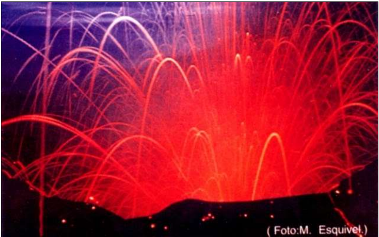
Fig.4. Trayectorias parabólicas de fragmentos incandescentes; desde el cráter del volcán Irazú en los 60's.

Más recientemente, en enero de 2010, inicio el periodo freático y freato-magmático más reciente del volcán Turrialba con incandescencia esporádica y supeditada a las erupciones puntuales que se produjeron en los años subsiguientes. Este último volcán y su incandescencia es el objeto de las secciones siguientes.