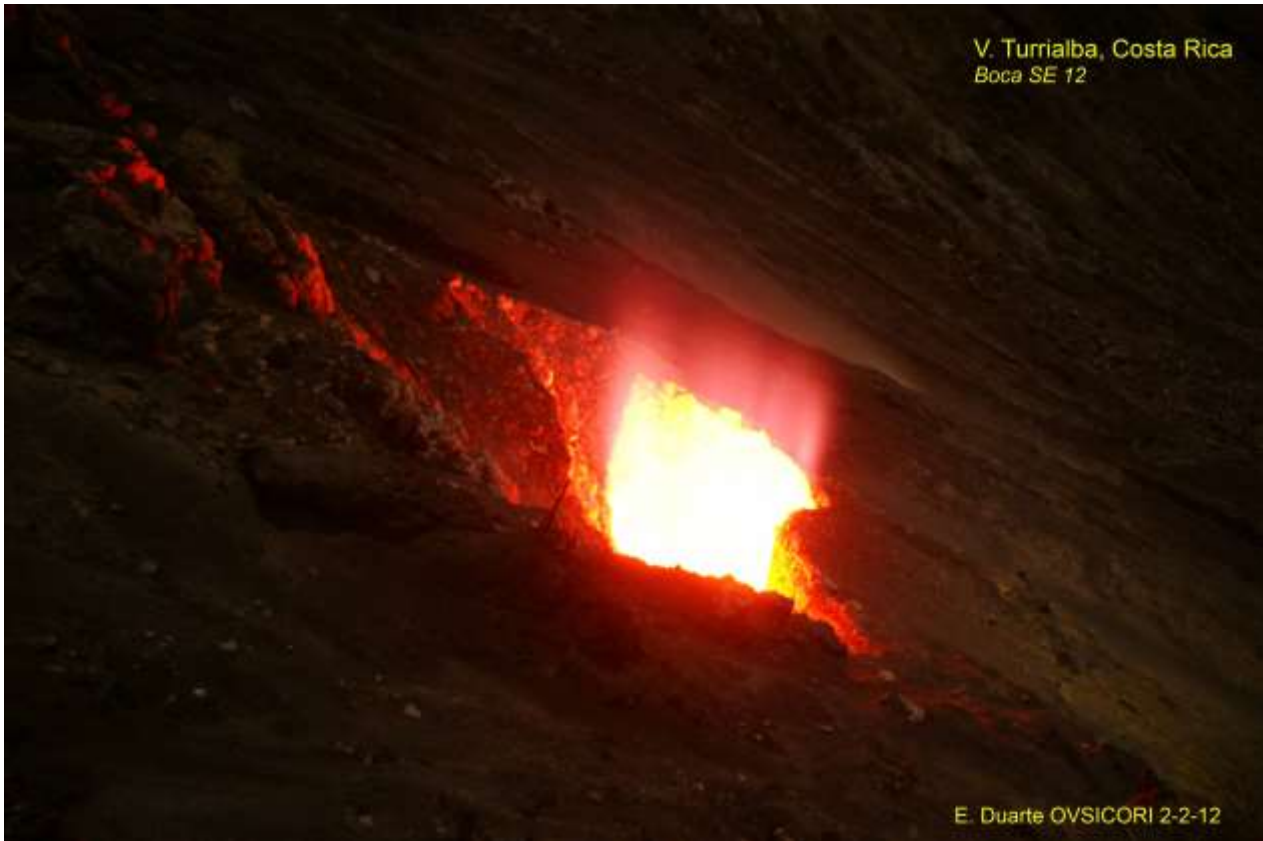
Fig.7. En esta imagen se pueden ver diferentes modalidades de incandescencia: de las paredes rocosas, de los gases y de las partículas que arroja el hueco. Temperaturas oscilaban entre 400 y 700°C.

Mayor incandescencia se repite en la ventila formada en enero de 2012; en el sureste del cráter activo. La cavidad casi circular se podía observar, desde la tarde oscura y la noche, con toda claridad; desde el mirador ubicado a unos 400m al sureste. La luminosidad, en forma de llama, se proyectaba en la atmósfera por decenas de metros y tenía diversas tonalidades. Esta incandescencia se mantuvo visible por meses (Fig.7).