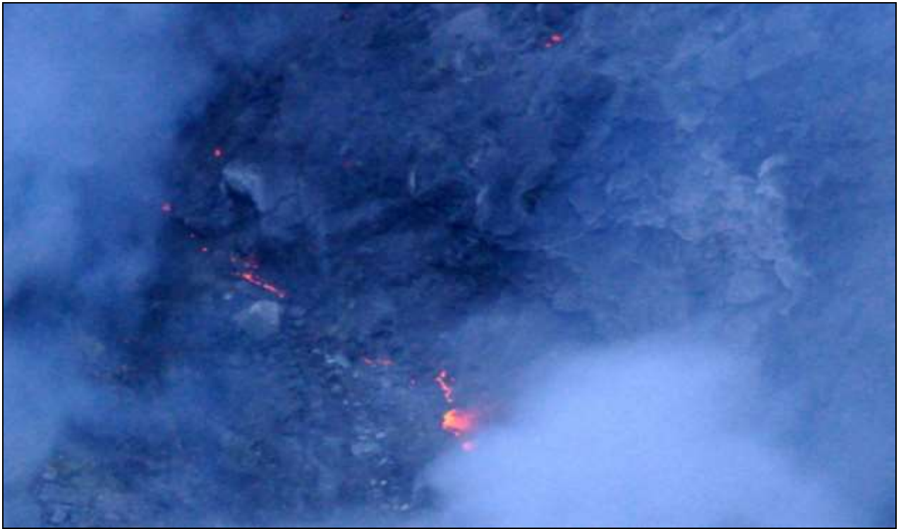
Fig.8. En esta foto tomada el 18 de febrero de 2015 se podía observar las grietas incandescentes en las paredes rocosas del cráter activo.

Más recientemente se han observado distintos eventos eruptivos que se hacen acompañar por bloques y otros materiales incandescentes. En el lapso de 2 años de actividad sostenida (octubre 2014 a octubre 2016) se han alternado diversas modalidades eruptivas: salidas de gases y vapor, erupciones freáticas y erupciones estrombolianas acompañadas de largos lapsos de salida pasiva y continua de ceniza la cual contiene fracciones pequeñas de magma juvenil.