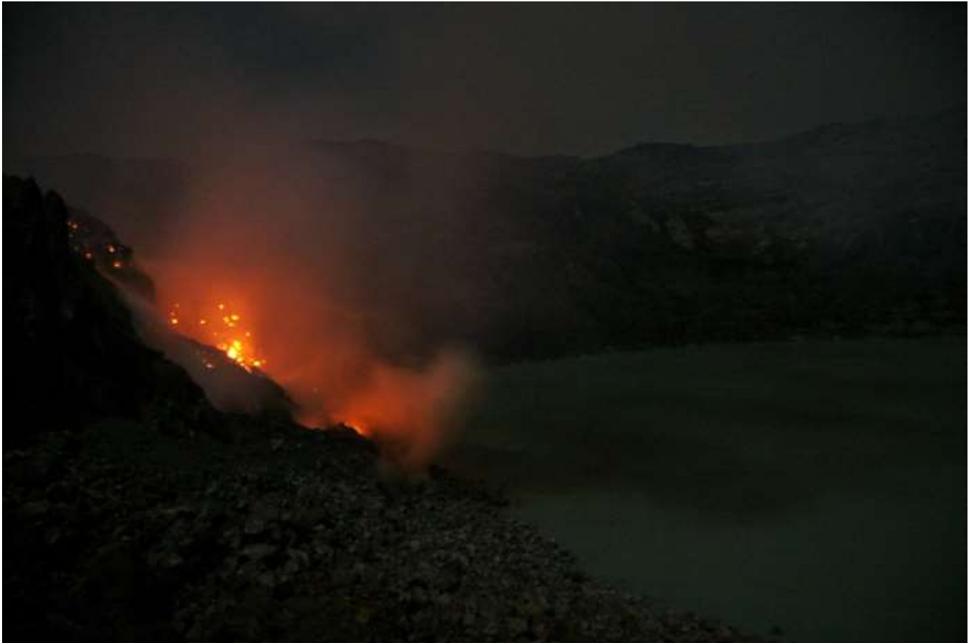
Fig.3. Vista parcial del domo, tomado desde la terraza este; en el volcán Poás.

El volcán Poás mostró recientemente rojos y amarillos encendidos en su domo en 1981 y más recientemente entre los años 2011 y 2012. Similar al Arenal, el reflejo del lado norte del domo se podía ver reflejado en las nubes oscuras y bajas sobre el lago cratéricos y sobre el mismo espejo de agua de la laguna caliente. Si bien los registros fotográficos del domo incandescente en los 80’s son muy escasos, se sabe que alcanzó poco más de 1000°C y podía verse radiante desde el mirador actual y desde otros puntos alrededor de la cavidad calderica. En años recientes los picos de incandescencia han variado en temperaturas desde los 400 hasta los 800°C. Esa temperatura corresponde tanto a la roca dura como a los gases medidos al salir de sus cavidades en el domo. (Fig.3).