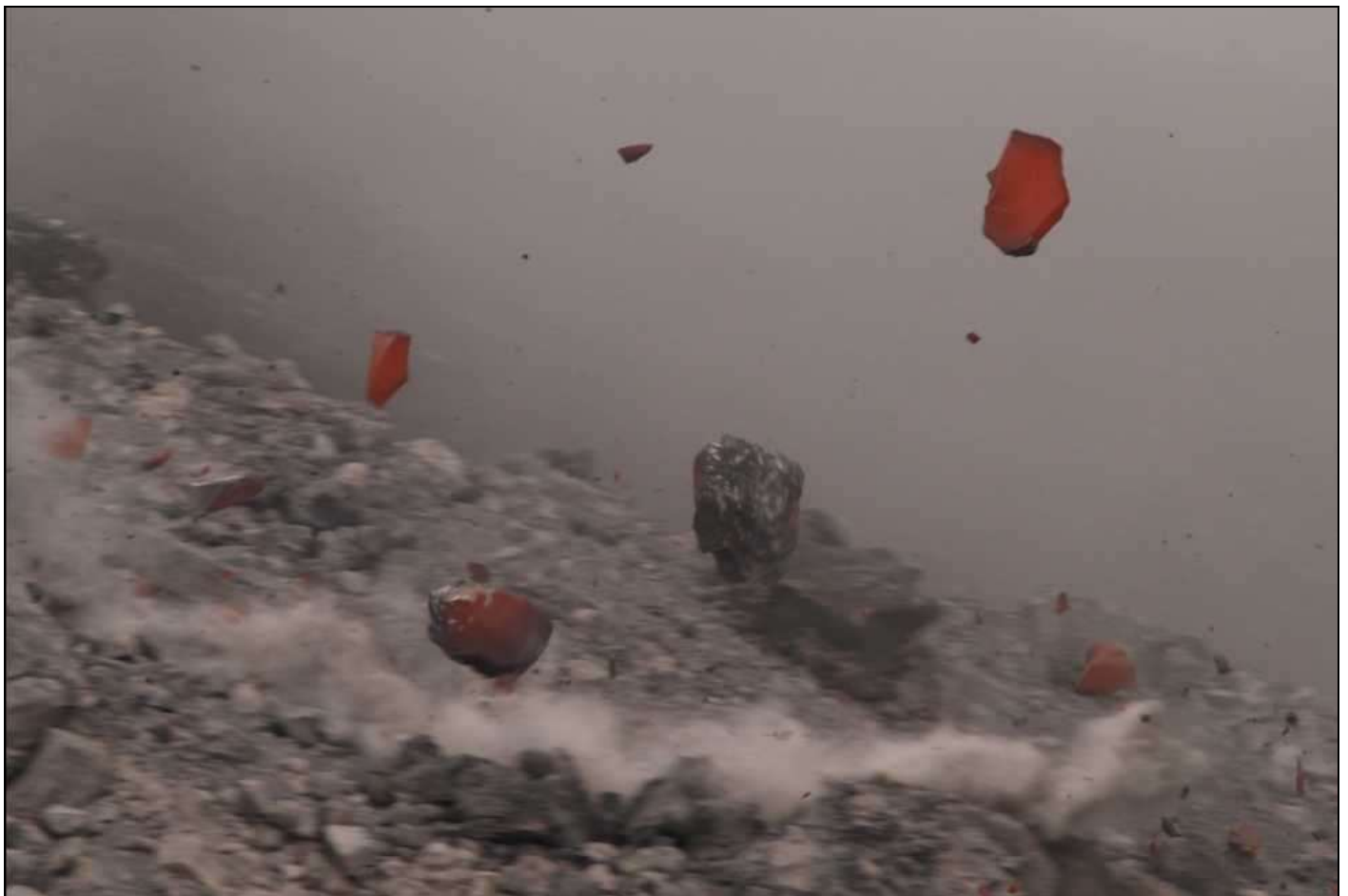
Fig.2. Fragmentos de bloques desprendidos de un frente de colada de lava en el volcán Arenal. Tomada el 10 de julio de 2009.

Por 42 años (1968-2010), para el caso del Arenal, la actividad intermitente mostró muchas modalidades de incandescencia. Los eventos más espectaculares se dieron cuando el cono completo se iluminaba con material resplandeciente que variaba desde amarillos intensos hasta rojos encendidos. Se daban otros momentos donde la incandescencia se mostraba como: inmensas flamas sobre la silueta de la cima, reflejo de la cima candente en las nubes bajas y caprichosas avenidas de bloques multicolores descendiendo rápidamente por alguno de sus flancos. Igual de espectaculares resultaban las nubes ardientes que descendían como bólidos por los valles de los múltiples drenajes que caracterizan este coloso.