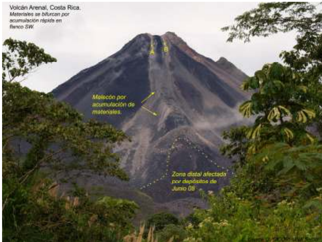
Fig. 1. Efecto de relleno de cárcava hacia sector suroeste hasta los 1200m.

Una nueva colada está siendo emplazada sobre el canal del flujo anterior (Fig 2).