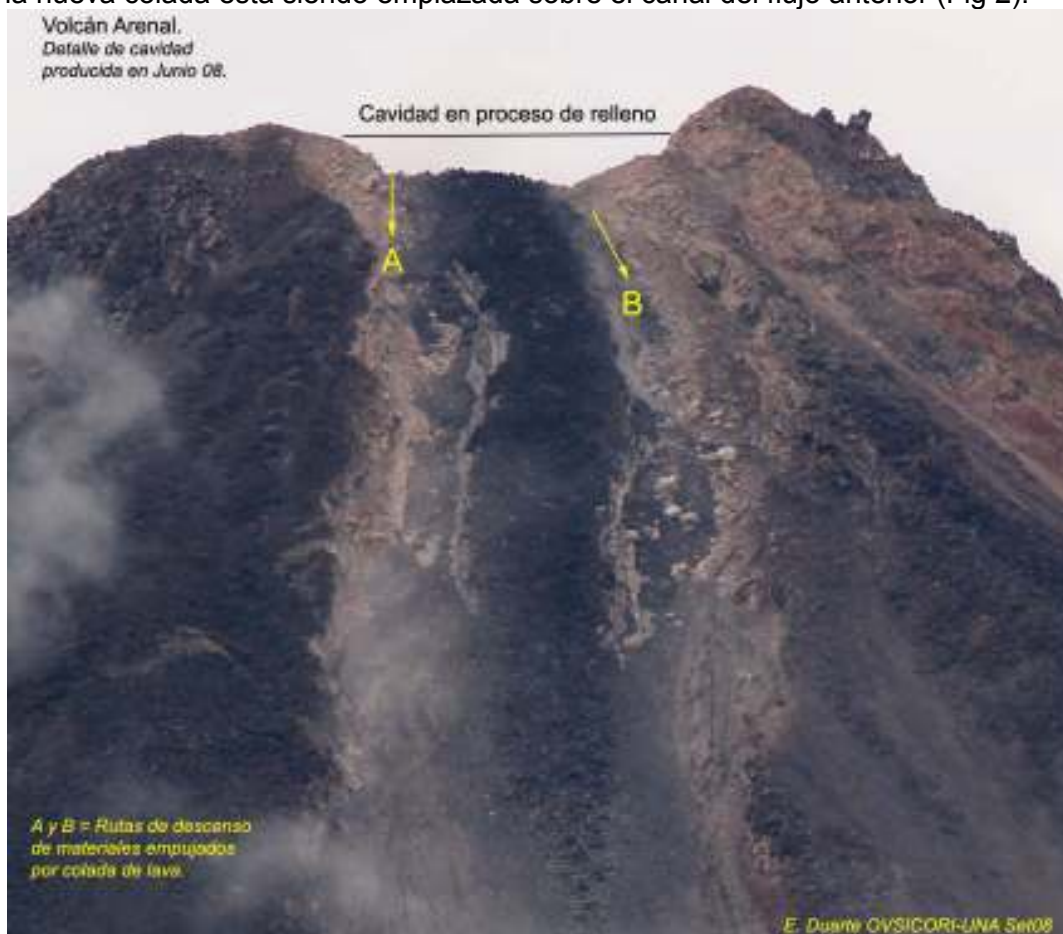
Fig. 2. Vista general de la nueva colada de lava emplazada sobre la cárcava generada en la pared suroeste.

Una nueva colada está siendo emplazada sobre el canal del flujo anterior (Fig 2).