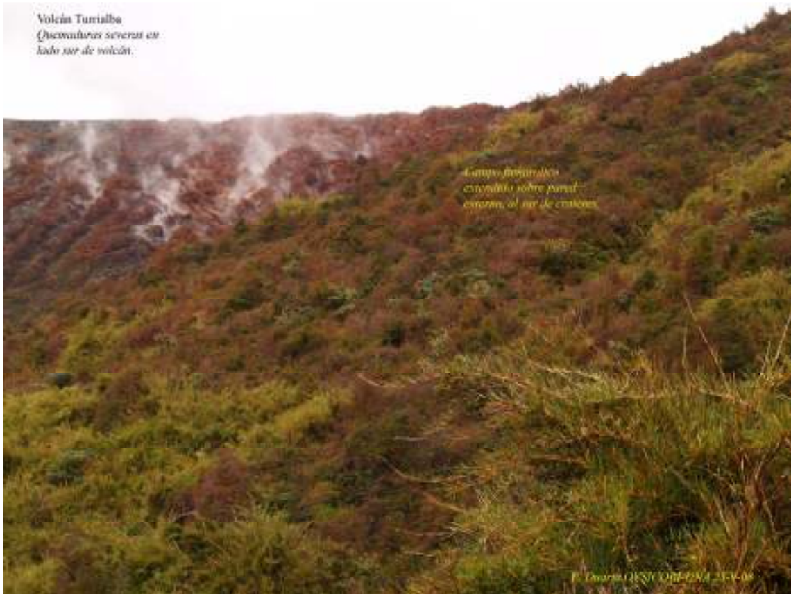
Fig 3. Sector superior con quemaduras totales cerca del borde de la caldera. Lado sur.