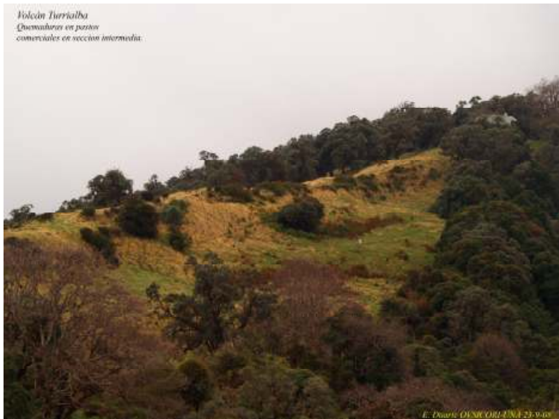
Fig 4. A unos 700 m al sur del borde los pastos muestran una apariencia amarillenta