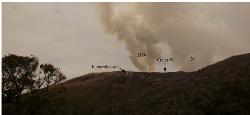
Fig. 6 Vista desde el lado sur. Dos chorros de gas proceden de 2 puntos distintos alrededor del cráter W.

Las fumarolas del flanco suroeste y noroeste se mantienen con emisión de gases entre bajo y moderado. Las fumarolas del flanco sur y sureste presentan emisión baja de gases en forma esporádica.-