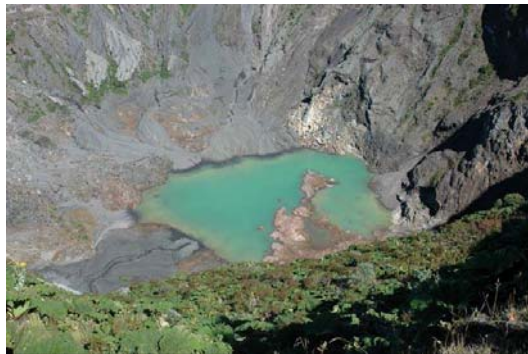
El Lago el 12 diciembre 2010.