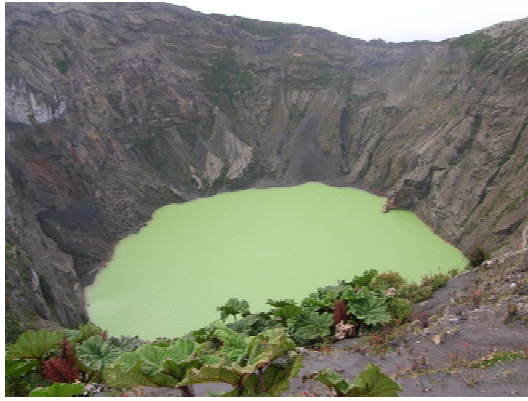
Lago del Irazú el 24 julio 2006.