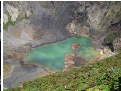
Lago del Irazú octubre 2011.