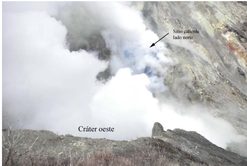
Fig. 5. Visual desde el borde sur del cráter W.

ruido similar al escape de una válvula de presión que se escucha desde el mirador y generan columnas de gases que alcanzan hasta 200m sobre el borde del cráter.