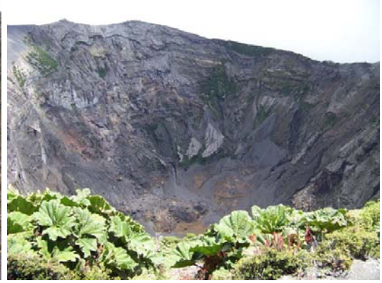
El Lago el 23 julio 2010.